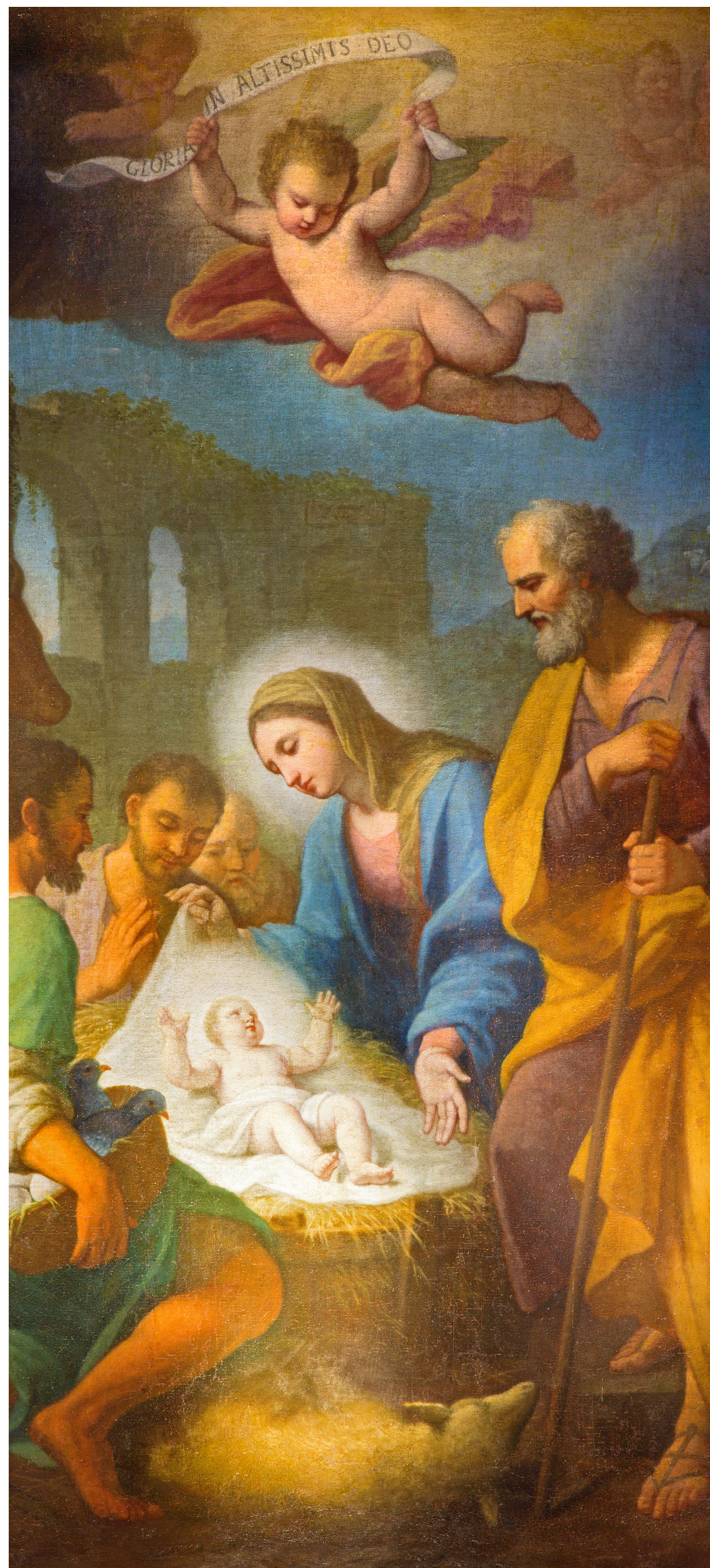
Stefano Parrocels (1696–1776). målning av Jesus födelse

Först därefter kunde man fastställa läran om Jesus som både sann Gud och sann män-